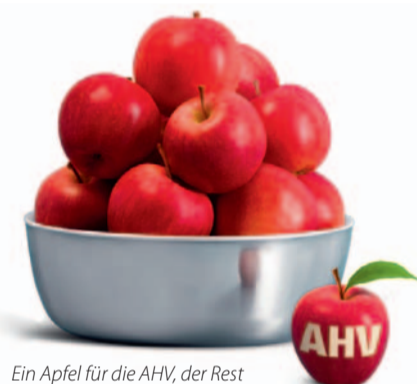
Ein Apfel für die AHV, der Rest bleibt bei den Erben.

Für die Beglaubigung der Unterschriften werden Helfer/innen gesucht, die