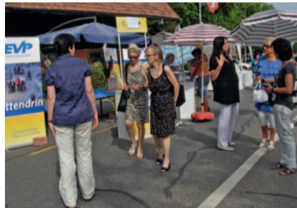
Am Herbstmärt gab's viele gute Gespräche.

schaftsaktion über 400 «Güggel» aus Zopfartig gebacken, hübsch verziert und zusammen mit einer Mlni-Broschüre über die ebenfalls anwesende EVP-Nationalrätin Marianne Streiff verteilt. Gleichzeitig wurden Unterschriften für die EVP-Initiative zur Erbschaftssteuer gesammelt.