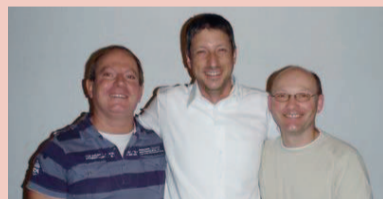
Le comité cantonal du PEV Jura.

Le Parti Evangélique Suisse a déjà été fondé en 1919 en tant que premier parti populaire de Suisse. Il est un parti du centre qui se base sur les valeurs chrétiennes. Il veut préserver la création, renforcer la famille en tant que noyau de la société, protéger la vie et élever la voix pour les pauvres et les faibles. Il veut traduire les valeurs de vie telles que la responsabilité, l'honnêteté, la durabilité ou la justice, dans une politique humaine.